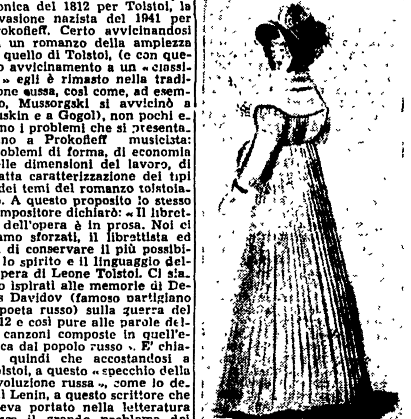
Un figurino di Sellián-Caldarini per l'edizione fiorentina di «Guerra e pace» di Sergio Prokofieff